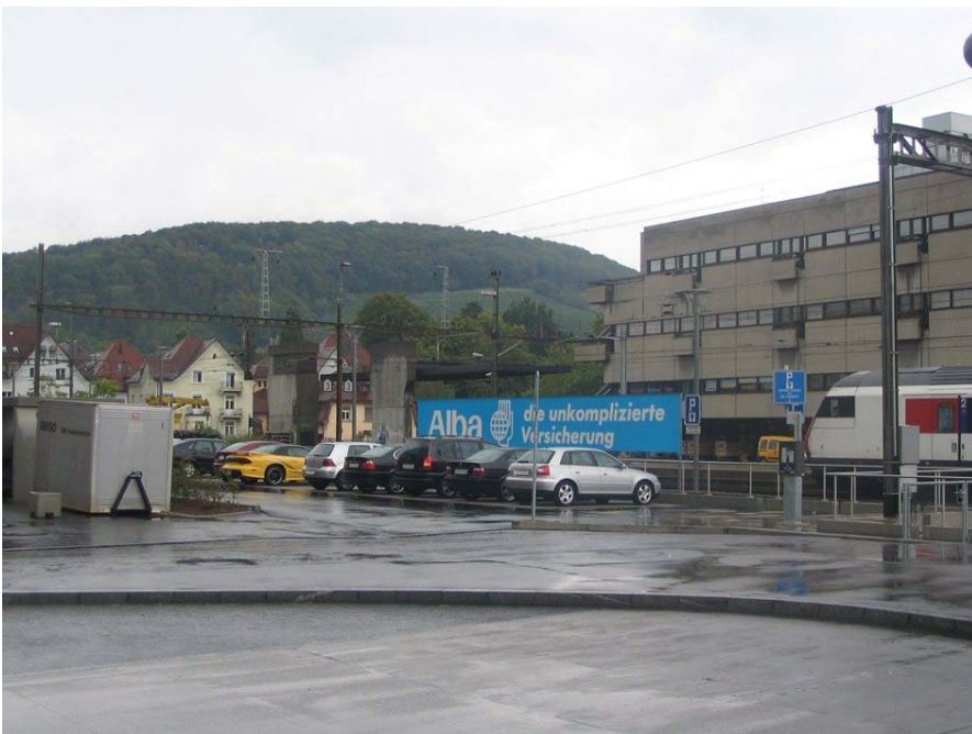
Foto Einfahrt P+R-Anlage Güterstrasse, vor Nordhaus C / Migros Klubschule

AGIS, Abteilung Informatik, Finanzdepartement des Kantons Aargau; Orthofoto © 2001 Kanton Aargau; Landeskarten © 2002 swisstopo (DV 642.2)